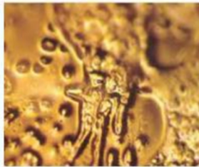
You Make Me Sick, I Will Kill You